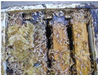
Fig. 1: Colonie d'abeilles mellifères détruites par les larves

Le petit coléoptère de la ruche ( Aethina tumida ) est un ravageur redouté des colonies d'abeilles sociales (abeilles mellifères, bourdons et abeilles sans dard), dont les adultes et les larves mangent le miel, le pollen et de préférence le couvain. Les pays européens étaient considérés jusqu'ici comme indemnes du petit coléoptère de la ruche. Les annonces de septembre 2014 concernant les premières découvertes d' Aethina tumida dans le sud de l'Italie sont alarmantes et requièrent également de la part des apicultrices et apiculteurs suisses une attention accrue et le contrôle régulier de leurs propres colonies d'abeilles.