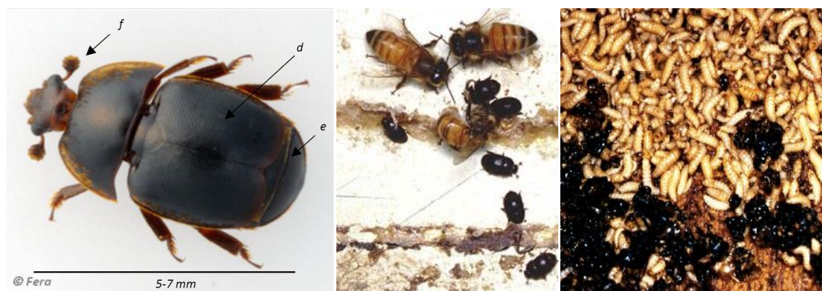
Fig. 4 a-c: a) Petit coléoptère de la ruche adulte (à gauche, © FERA), comparaison de taille entre l'abeille (b) et c) la larve du coléoptère (© E. Hüttinger).

On trouve le plus souvent les coléoptères dans les fentes et les fissures ou sur la face intérieure postérieure du couvercle. C'est la raison pour laquelle le début de l'infestation passe très facilement inaperçu dans des colonies d'abeilles de force normale.