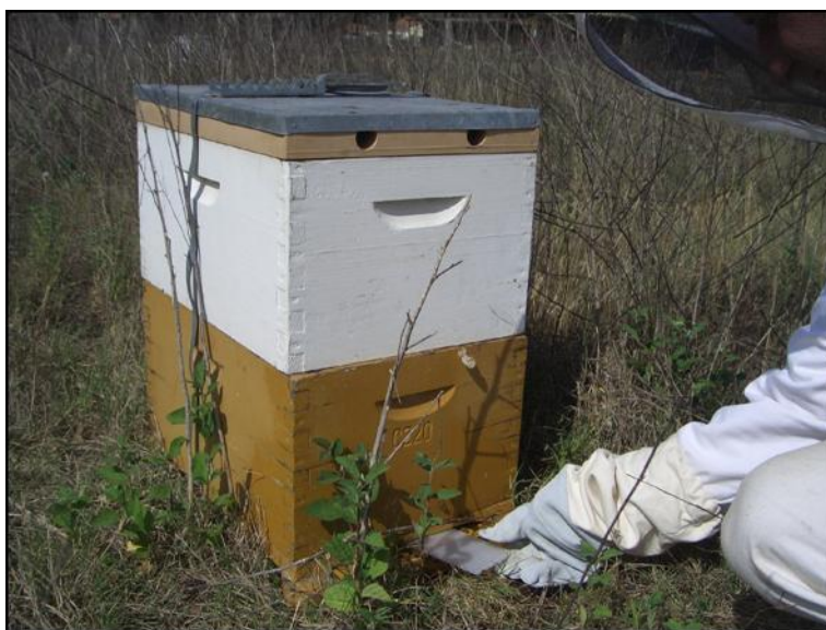
Fig. 5: Les bandelettes en plastique sont introduites dans la ruche par le trou d'envol, puis elles sont retirées rapidement après >12 heures et placées dans un sachet. Les coléoptères adultes se cachent de préférence dans ces pièges.

La propagation effective en Italie du petit coléoptère de la ruche n'étant actuellement pas encore précisément connue, il ne faudrait pas importer, resp. ne pas (r)amener en Suisse des colonies d'abeilles, des reines ou du matériel apicole usagé en provenance d'Italie jusqu'à ce que l'on ait des informations fiables. Il faudrait de manière générale renoncer aux achats d'origine inconnue. Il y a lieu d'examiner le couvain à chaque contrôle de la colonie. En cas de découverte de coléoptères ou de larves suspects, les apicultrices et apiculteurs devraient s'adresser à leur inspecteur des ruchers qui enverra des échantillons au Centre de recherches apicoles (CRA) après entente préalable. Les échantillons peuvent facilement être prélevés à l'aide de bandelettes de diagnostic Schäfer (voir fig. 5):