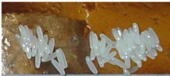
Fig. 2: Ponte d'œufs du petit coléoptère de la ruche

Larves: la larve constitue le stade de développement nuisible pour la colonie d'abeilles et le matériel apicole entreposé. Elle atteint une longueur allant jusqu'à env. 1 cm, est de couleur crème et pourrait au premier coup d'œil être confondue avec la larve de la fausse teigne (voir fig. 2). Mais en l'observant de plus près, on peut la distinguer facilement de cette dernière grâce à ses 3 paires de pattes antérieures (a), aux poils épineux sur le dos de chaque segment du corps (b) et aux deux grands processus épineux à l'extrémité postérieure (c).