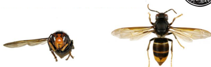
Frelon asiatique à pattes jaunes, Vespa velutina var. nigrithorax

Le frelon asiatique à pattes jaunes, Vespa velutina , est à dominante noire, avec une large bande orange sur l'abdomen et un liseré jaune sur le premier segment. Sa tête vue de face est orange, et les pattes sont jaunes aux extrémités . Il mesure entre 17 et 32mm.