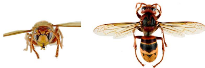
Frelon d'Europe, Vespa crabro

Le frelon d'Europe , Vespa crabro , a l'abdomen à dominante jaune clair, avec des bandes noires. Sa tête est jaune de face et rouge au dessus. Son thorax et ses pattes sont noirs et brun-rouges . Les ouvrières mesurent entre 18 et 23mm et les reines entre 25 et 35.